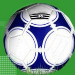
PIŁKA – nr 5; 5 szt.